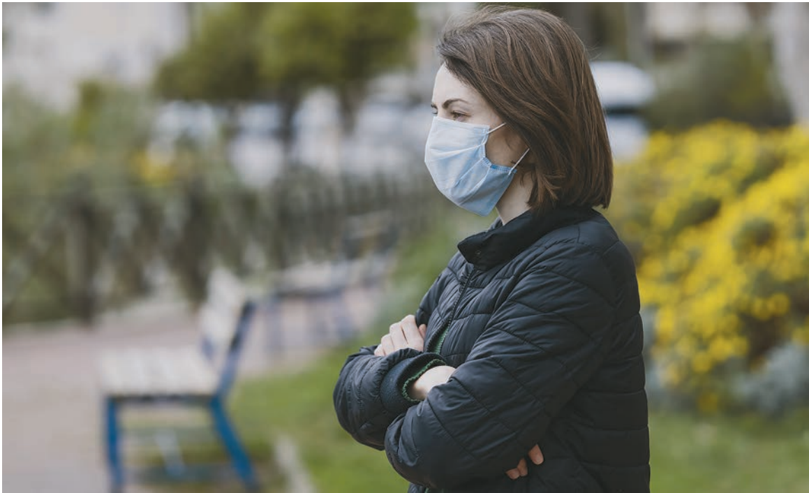
Grüne Erholungsgebiete sind für die psychische Gesundheit der Städter im Lockdown wichtig.

versetzen, besser auf die Nebeneffekte der kurzzeitigen Urlaubsvermietungen in den europäischen Metropolen zu reagieren.