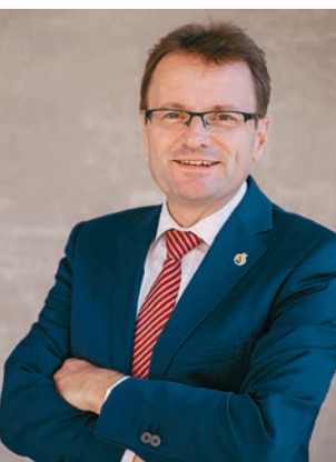
Hannes Heide ist Abgeordneter im Europäischen Parlament. Er fordert mehr EU-Unterstützung für nachhaltige Tourismuskonzepte in kleineren Urlaubsregionen.

Leistbares Wohnen ist wegen der wirtschaftlich schwierigen Coronazeit wichtiger denn je. Deshalb gehört das Thema ganz oben auf die Agenda des EU-Wiederaufbauplans.