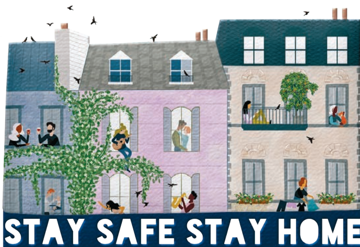
Der angeordnete Rückzug in die eigenen vier Wände ist nicht immer leicht, aber er rettet Leben.

Ein offenerer Datenzugang könnte Regierungen in die Lage