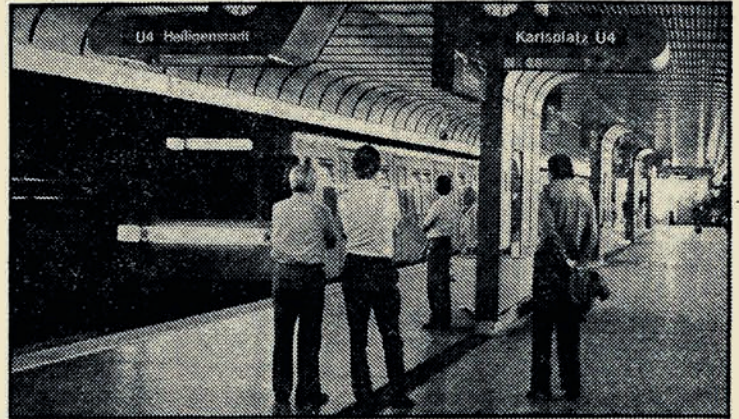
Ende November wird auch die U 1 verlängert

Die am 27. September in Betrieb genommene neue Straßenbahnlinie 64 vom Westbahn-