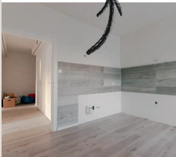
Und plötzlich war die Küche da...