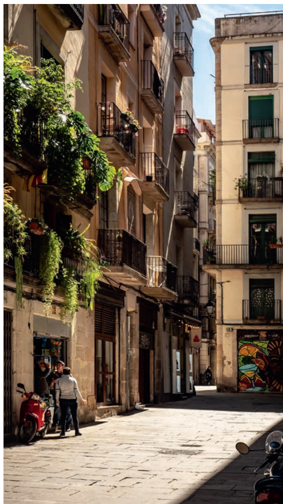
Barcelona: Ein Mietendeckel soll Wohnen wieder leistbar machen.

Dass der Berliner Mietendeckel zum Exportschlager werden konnte, sei durch die konkrete internationale Zusammenarbeit der Mieterschutzverbände zustande gekommen. »Das ist unser Credo als IUT: das Beste aus jedem Land umsetzen, aus Fehlern gemeinsam lernen.«