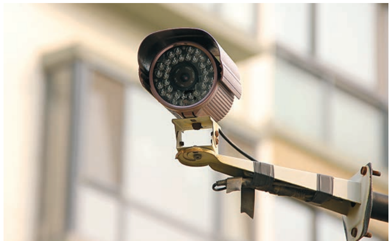
Datenschutzgrundverordnung und -gesetz schränken überbordende Überwachung ein.

mietervereinigung.at/738/ Leistungsumfang-Zuständigkeit