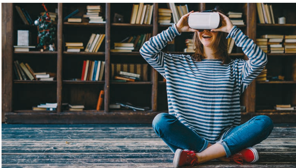
Wohnungsbesichtigungen mit VR-Brillen: Derzeit noch die Ausnahme, aber im Kommen.