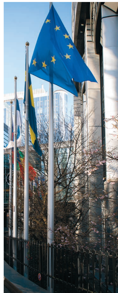
EU-Parlament verhandelt Bericht zu Wohnen.

Ein wichtiger Eckpunkt ist auch der Schutz vor »renoviction«, also Kündigung des Mietvertrages durch Renovierung und Verteuerung der jeweiligen Wohnung. In den nächsten Jahren wird es auf Grund des Europäischen Grünen Deals zu mehr Renovierungen kommen müssen, damit der Energieverbrauch von Häusern sinkt und wir so die Umwelt besser schützen. Dies sollte aber nicht den aktuellen Mietern sowie der sozialen Durchmischung und der